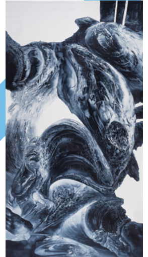
藤森 哲 (tableau2020-09 (Kushan))