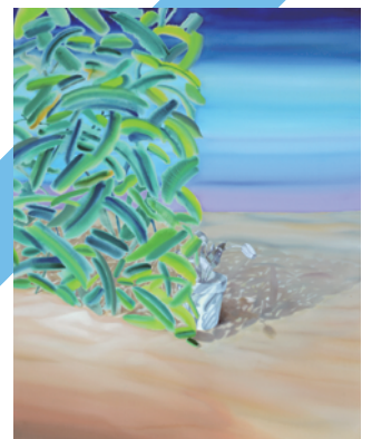
福嶋 さくら (stolen landscape)