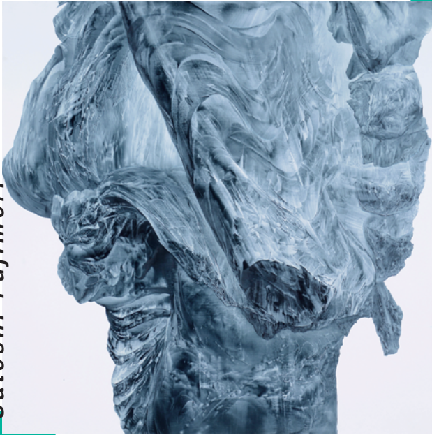
(tableau 2021-02 (Kushan))